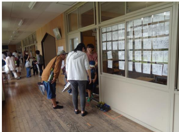
【教室での引き渡しの様子】