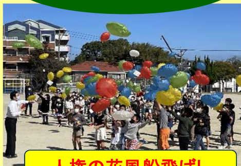
人権の花風船飛ばし