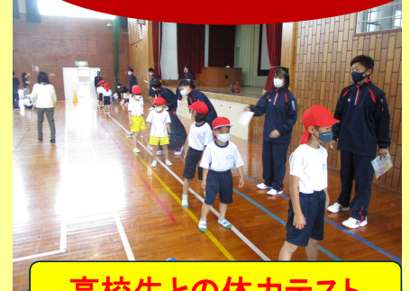
高校生との体カテスト