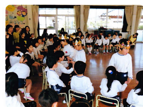
たんじょうかい 2月18日