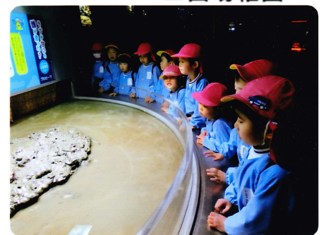
おわかれえんそく 3月5日