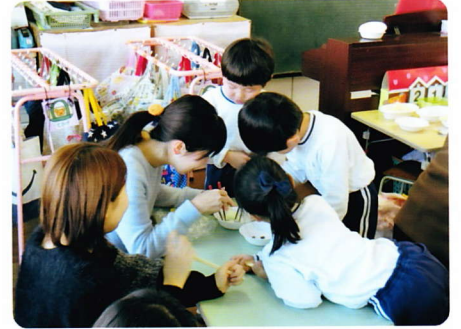
ねんしょうほいくさんか 2月1日