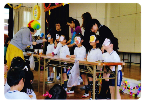
ありがとうかい 3月8日