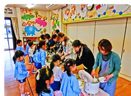
おわかれかい 2月26日・28