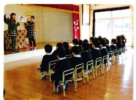
しゅうりょうしき 3月20日