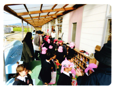
おごおりとのこうりゅうかい 3月18日