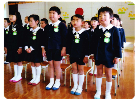
そつえんしき 3月14日