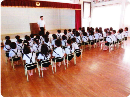
しぎょうしき 9月5日