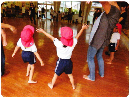
ねんしょうほいくさんか 9月14日