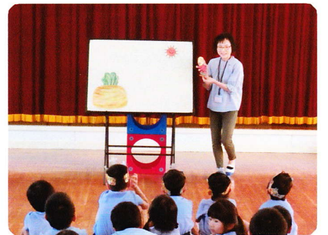
8がつのたんじょうかい 8月31日