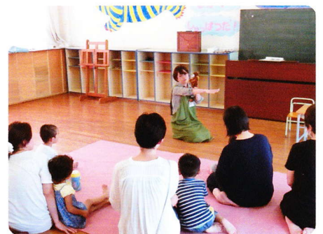
えほんのひろば 9月18日