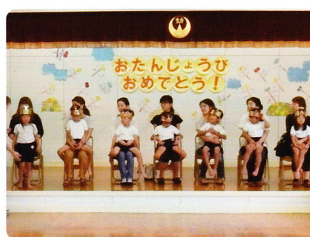
たんじょうかい 9月21日