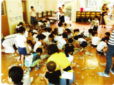
なかよしひろば 8月7日