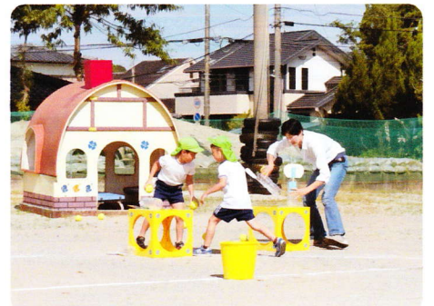
ねんちょうほいくさんか 9月13日