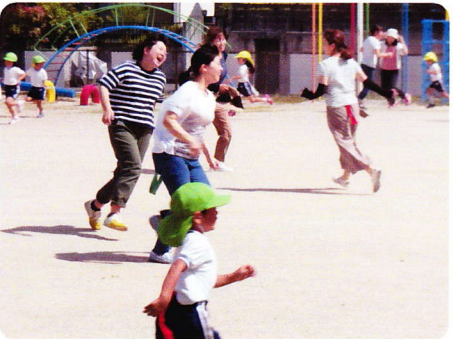
ほいくさんか 5月18・22日