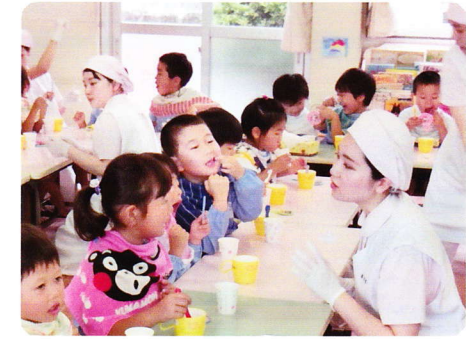
はみがききょうしつ 5月31日