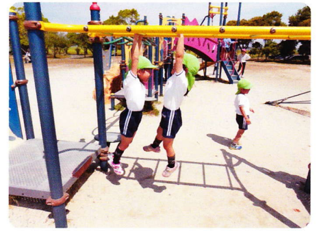
かんげいえんそく 5月1日