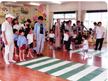
こうつうしどう 5月28日