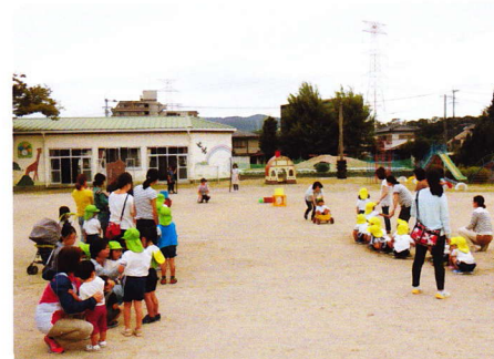
ほいくさんか 9月14・15日