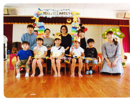
たんじょうかい（ごうどう） 9月22日