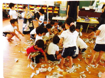
なかよしひろば 9月8日