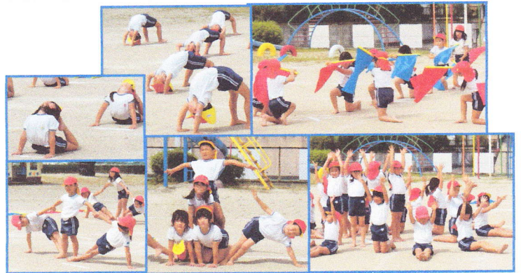
〈 年長組ダンス「これからもずっと友だち」の練習風景 〉

運動会では、クラスだけでなく、全園児が関われるように、チームの競技も行います。また、お家の方はもちろん、おじいちゃん・おばあちゃん、卒園児の皆さんも参加していただき、子どもたちと一緒に運動会を楽しんでいただきたいと、“親子競技”や“祖父母の競技”“卒園児競技”なども行います。未就園児のお友達の競技もあります。たくさんの方の参加をお待ちしています。