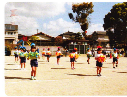
しょううんどうかい 9月28日