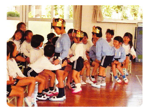
たんじょうかい(ごうどう)10月27日