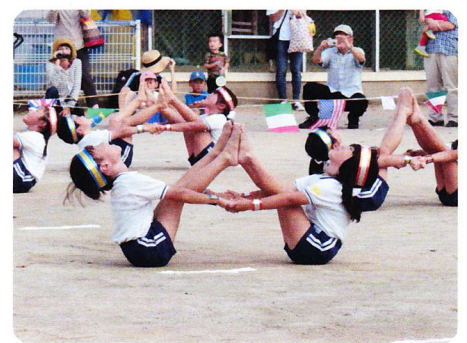
うんどうかい10月7日