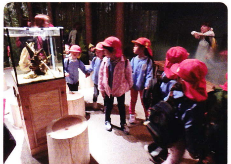
あきのえんそく10月23日