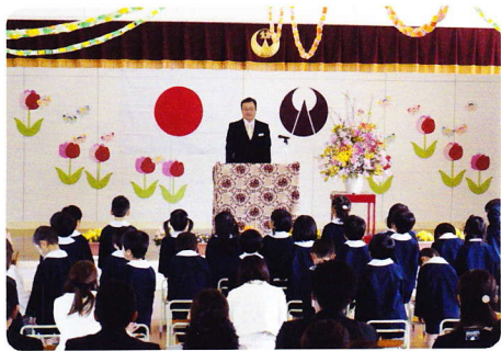
にゅうえんしき 4月12日