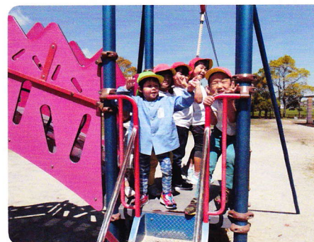
おやかかんげいかい 4月28日