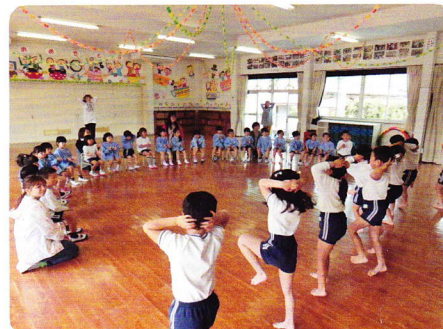
かんげいかい 4月21日