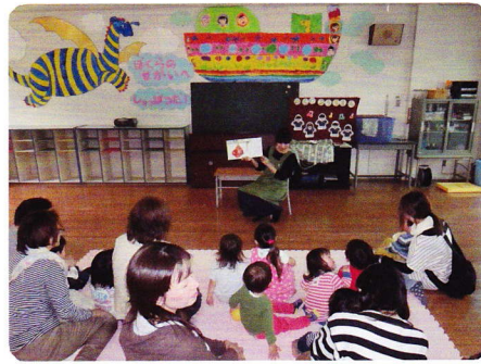
えんかいほうび 4月25日