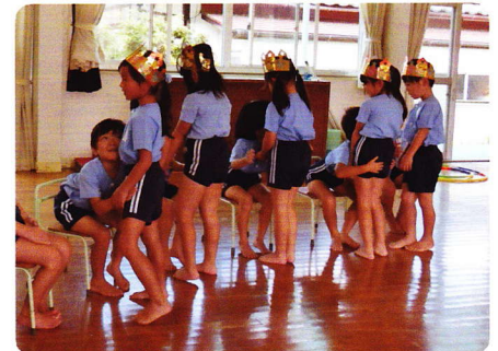
たんじょうかい(ねんちょう) 8月30日