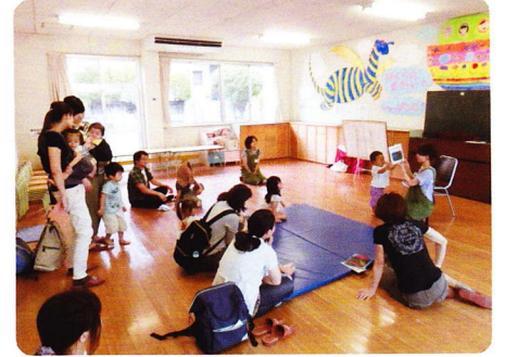
えんかいぼうび 8月9日