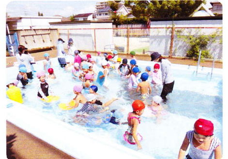
ぷーるのうかい 8月30・31日