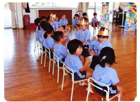
たんじょうかい(ねんしょう) 8月31日