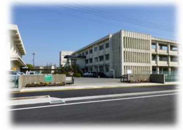
北西から望む校舎