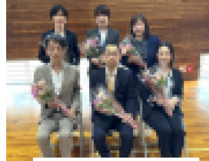
退任役員のみなさま

4月19日(金)の授業参観・学級懇談会・PTA総会、そして歓送迎会に参加していただいた保護者のみなさま方、本当にありがとうございました。授業参観では、少し緊張しながら学習している子どもたち、いつもより表情の硬い先生方の姿が見られました。また、短い時間でしたが学級懇談会では、保護者のみなさまの思いや願いなども聞かせていただき、子どもたちの成長を願う親の思いが伝わってくる有意義な時間がもてたことに感謝しております。PTA総会もスムーズに終わることができ、一年間の活動計画等が決定しました。これからも保護者のみなさまと協力し合い、子どもたちが着実に成長できるように努力していきたいと思いますので、よろしくお願いいたします。