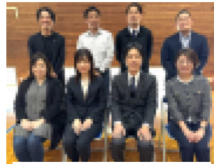
本年度役員のみなさま