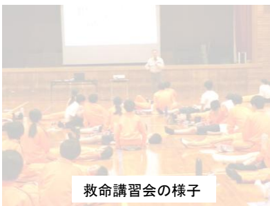
救命講習会の様子

4月22日(水)に1年生は、「普通救命講習会」を実施しました。「身のまわりにいる人に危機が生じたとき、その場面に遭遇したとき、人命尊重を最優先とし、迅速かつ冷静に対応するための適応力を身につけること、自分の身を自分で守るための行動を考える機会にすること」を目的に毎年入学してすぐの1年生が講習を受けています。当日は、久留米広域消防本部三井消防署の方々