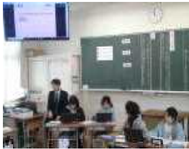
【黒板書記はタブレットで】

1月19日(金)に、3年生の学級会を参観しました。3年生は、学級会がとても上手でした。自分たちで話し合いを進めるのは大人でも難しいのですが、すごいなあと感心しました。今の学級会は、記録をするのが黒板ではなく、書記の子がタブレットで打って拡大モニターに映すということにも驚きました。タブレットを大変上手に使いこなすようになってきました。