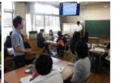
【小中合同で授業整理会】