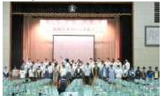
【6年生から中3による合同合唱】

10月19日(木)に、6年生が立石中学校の文化発表会を参観しました。素晴らしい歌声を響かせる中学生の姿を見て、6年生の子どもたちは、「中学生の歌声がとてもきれいで、大きく迫力がありました。」「歌声のハーモニーが美しく、6年生も参考にしていきたいと思いました。」「6年生の歌声はまだ小さいことに気づきました。仲間を大切にしてほしいというメッセージが伝わってきました。」という感想をもっていました。中学生からとてもよい刺激を受けています。本校区の小中一貫教育は本当にありがたいです。