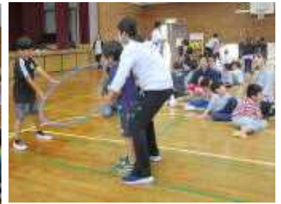
【ダンスの見せ合い】