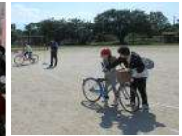
【1年生交通安全教室】