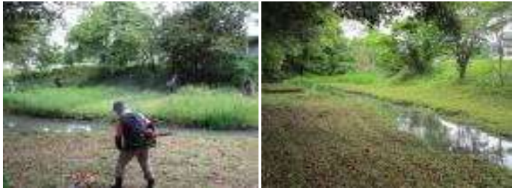
【みどりの小川の草刈り】 【こんなにきれいに】

立石校区は、地域の方々がたくさん学校へ関わってくださっています。地域の力、とてもありがたいです。5月1日(日)に青少年育成部会の方々が、くろつちタイムでも使わせてもらうみどりの小川の草刈り作業をして、とてもきれいにしてくださいました。次は6月26日(日)にさせていただきます。おかげで、子ども達が安心してくろつちタイムの学習に臨むことができます。